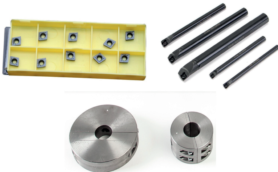
Рисунок 4. Инструментальная оснастка

Примечание. Если вам нужны инструментальные оправки, втулки, резцы, пластины обращайтесь в компанию «САРМАТ».