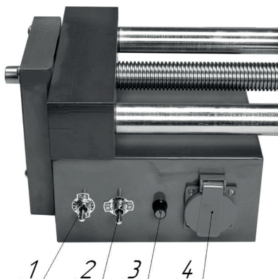
Рисунок 2. Элементы управления

На рис. 2 приведены основные элементы блока управления.