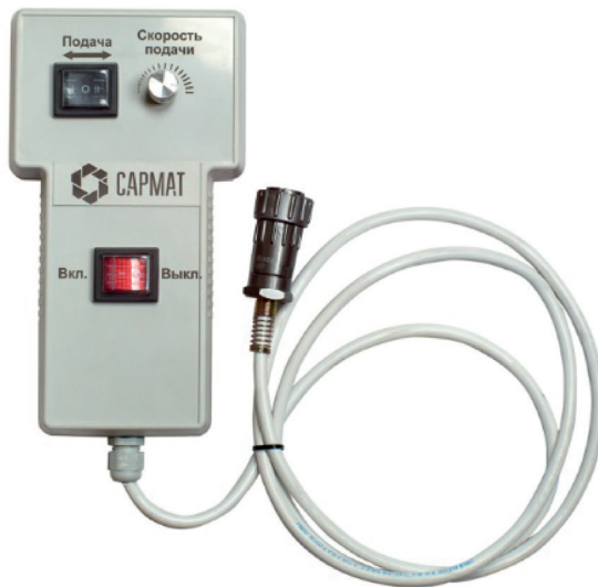
Рисунок 4. Пульт управления